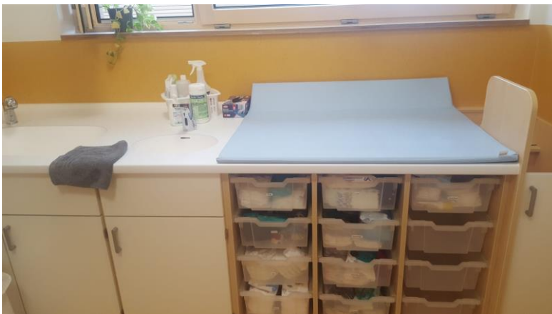
Waschraum und Wickeltisch